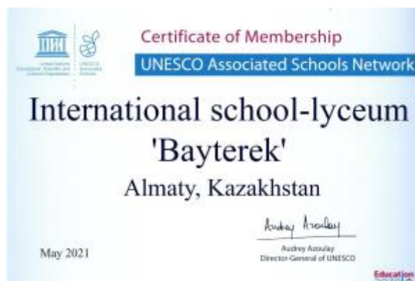
3 - Огромная работа велась и в направлении вступления в ряды Ассоциированных школ ЮНЕСКО