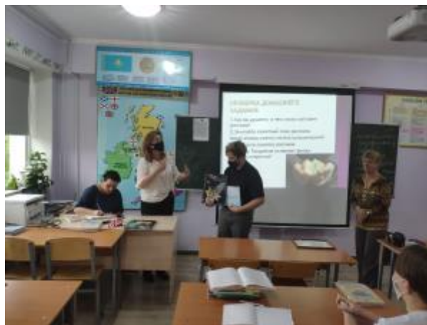
5 - Казахстанский республиканский конкурс водных проектов